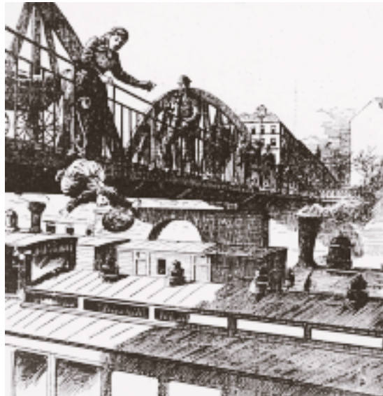
(Abb. 7): „Eine Schreckensscene auf der Westbahnbrücke“, 1893 (Illustriertes Wiener Extrablatt. 14. 4. 1883)

Es war vor allem die Großstadt, in der das steigende Bedürfnis nach Mobilität und „Communication“ eine Vielzahl an unterschiedlichsten Brücken entstehen ließ, an deren Überquerung sich die Bevölkerung allmählich zu gewöhnen hatte. Regelmäßige Kontrolle des Bauzustandes, Erlass von strengen Sicherheitsvorschriften und Erziehung zur disziplinierten Brückenquerung wurden zu Mitteln, mit denen man die Angst in den Griff zu bekommen hoffte. Doch selbst bei den stabilsten Brücken waren, wie sich immer wieder zeigte, die schmalen, nur durch ein Gelände markierten Grenzen nicht unüberwindbar. Meldungen über Brückenunfälle erregten in der Öffentlichkeit besondere Aufmerksamkeit, prangten sogleich auf den Titelseiten der Boulevardzeitungen. So berichtete das „Illustrierte Wiener Extrablatt“ im