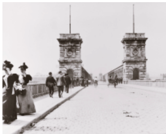
(Abb. 6): Windumtoste Passanten auf der Kronprinz-Rudolf-Brücke, 1897

Donaukanal feststellen. Von der hier einst anzutreffenden Brückenpracht ist nach dem 2. Weltkrieg nur mehr wenig übrig geblieben. Die rasch aufgezogenen Neubauten fielen vergleichsweise schmucklos aus, wurden in erster Linie den Bedürfnissen des fließenden Verkehrs angepasst. Für sie gilt denn auch, was Robert Musil einst generell über Denkmäler sagte: Sie werden im Regelfall nicht bemerkt. So nehmen nur mehr wenige wirklich wahr, dass die Bezirke 2 und 20 eigentlich eine – ausschließlich über Brücken erreichbare – Insel bilden (die ehemalige „Mazzesinsel“).