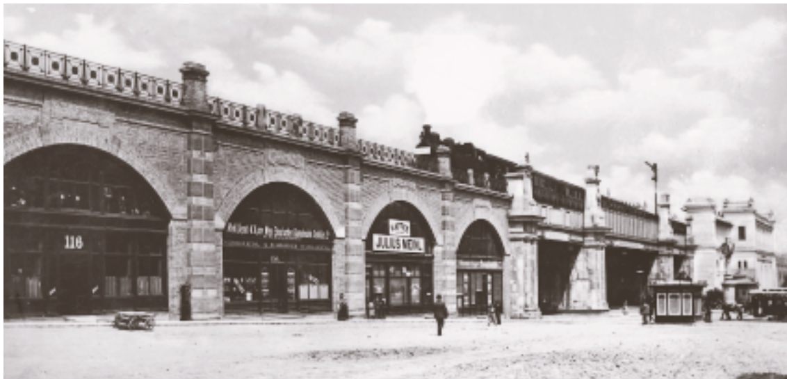
(Abb. 4): Mobilisierung des Blicks: Stadtbahn, um 1900

Mitzuschauer in den höchsten Stockwerken der Häuser winken, gleichen winzigen Papierschnitzeln. (...) War früher der Zug in der Tiefe, so schwebt er jetzt in der Höhe, auf dem Viadukt, von dem aus sich schöne Durchblicke durch die langen Straßenzüge rechts und links eröffnen. (...) Aber hier oben im Stadtbahnzug muss man sein. Das ist überhaupt ein Vergnügen an der Fahrt, so lange sie zwischen Alt- und Neuwien, den Gürtel entlang hinführt, dass man die Straßen, die man Tag für Tag zu wandeln gewohnt ist, aus der Vogelperspektive sieht, an einigen wenigen Stellen aus nicht unbeträchtlicher Höhe, meistens von der Erhebung eines niedrig ziehenden Vogels.“ 11 (Abb. 4)